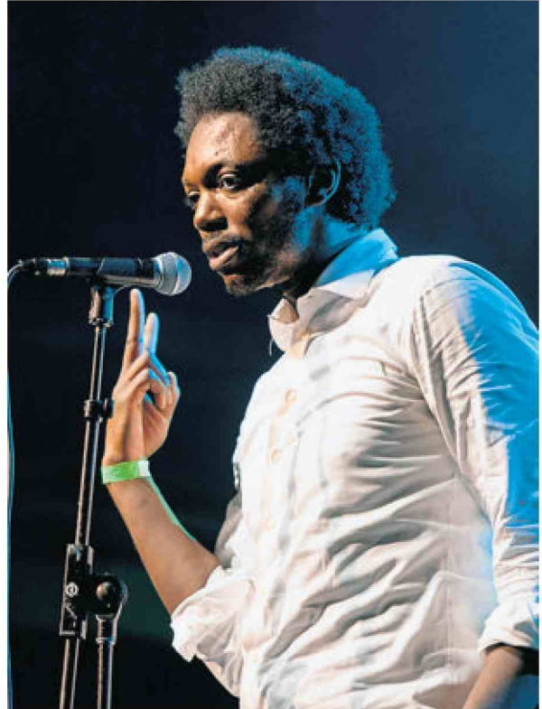
Baloji Le poète, rappeur et acteur belge d'origine congolaise n'hésite pas à mélanger samba et rap.