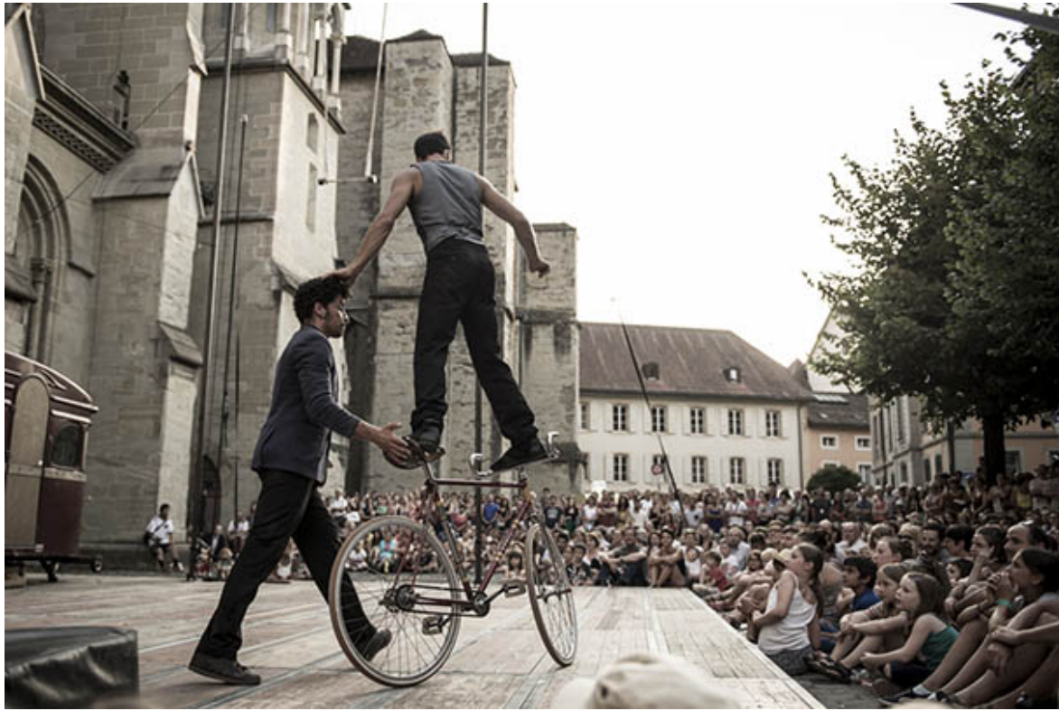
Collectif Malunés (Belgique) « Sens dessus dessous ».